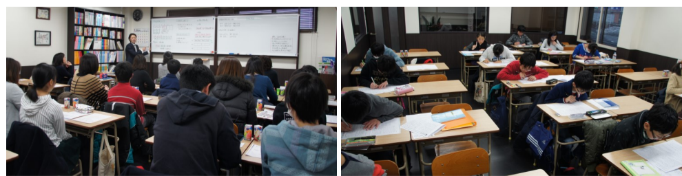
※昨年度の準備講座説明会とその後の確認テストの様子。説明会では上記内容に加え、自塾の中学部の授業形態等のご説明も差し上げます。